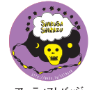
アーティストバッジ